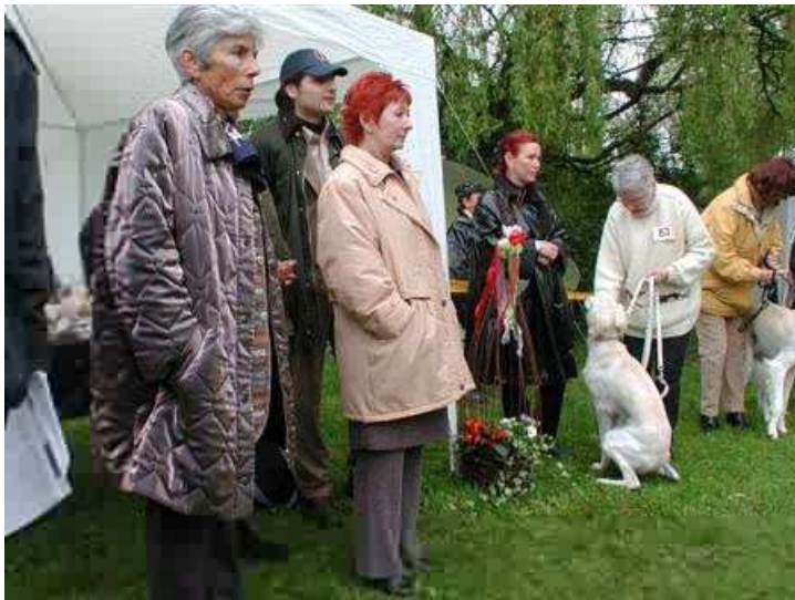
Begrüßung und Vorstellung der Richter

Ich habe viermal Salukis auf Championship Shows in England gerichtet. Das erste Mal im Jahr 1986 auf der CC-Zuchtschau des Scottish Kennel Clubs und das letzte Mal beim Welsh Kennel Club im Jahr 1999.